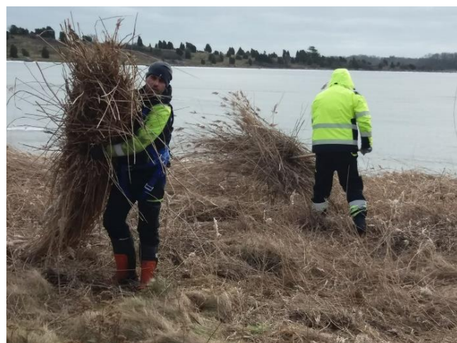
Røjningsverksamheter i Listerby - Slättanäs naturparken.