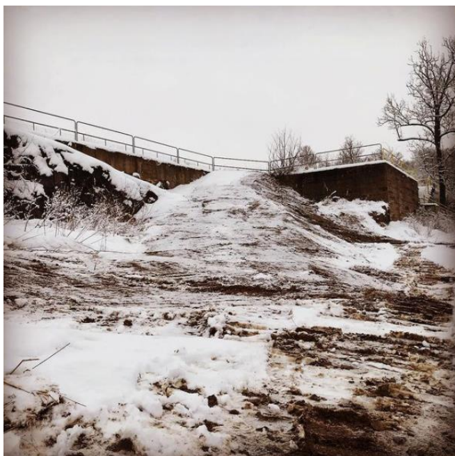
Vinterbild från Djupafors kraftstation när arbetet pågick

Tack säger vi också till Uniper och Garnborn för medfinansiering till detta. Nu kan man ta sig upp till Djupaforsklyftan även på västra sidan av Ronnebyån.