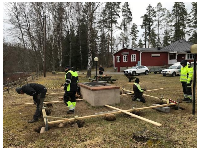
Förberedning byggnation av taket över grillplatsen i Strångamåla