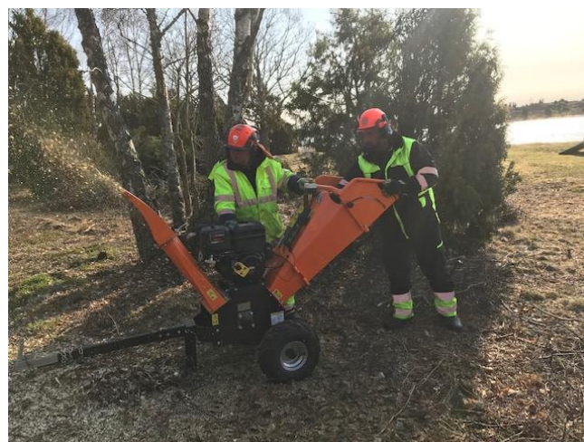
Den nya flismaskinen testas