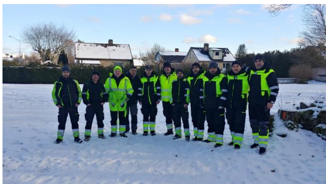
Arbetslaget i januari 2021. Under tiden har laget ökat till 14 deltagare.

I januari startade projektet med ett dels nytt arbetslag. 14 deltagare (nystartsjobb) samlar bred kunskap och erfarenhet genom att jobba med naturvård. Alla är mycket kunskapsörstärkt och jobbar hård för att klara alla försköningsverksamheter på landsbygden i hela Ronneby kommun!