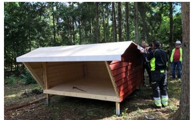
Det här vindskyddet vid Hålabäck har byggts i samband med projektet Ronnebyslingor.